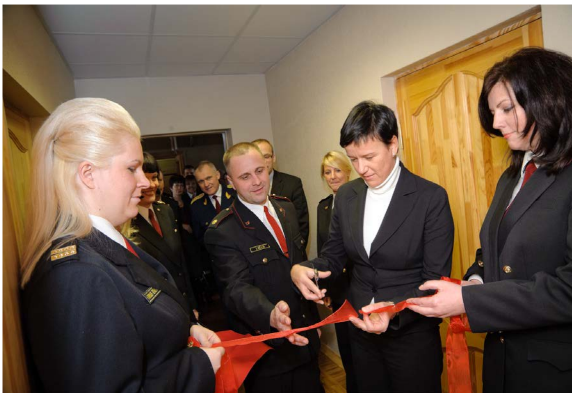
Svinīgajā atklāšanā piedalījās arī Iekšlietu ministre Linda Mūrniece.

Uz 2012.gada 1.jūliju Sakaru punktā strādā 5 jaunākās inspektore, 11 dispečeres, vecākais speciālists, SP priekšniece – inspektore seržante Ksenija Bendzule-Zālīte.