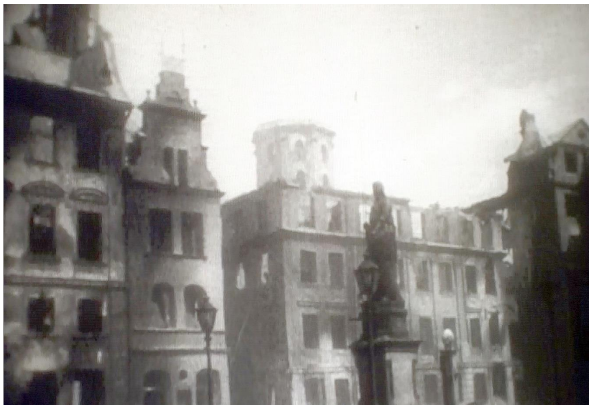
Izdegusi Vecrīga un sagrautais Pētera baznīcas tornis

“Pētera dienas rītā, 29.jūnijā, šaušana, kas nakti bija mitējusies, atsākās. Logu rūtis drebēja, dakstiņi plakšķēdami krita pagalmā. Pēkšņi kāds iesaucās: “Ļautiņi mīlie, Pētera baznīca deg! Laikam bumba ķērusi, gar torni melni dūmi griežas!” Es uzskrēju savā istabā, tās logs bija tieši pretī Pēterbaznīcai. Uguns un melni dūmi griezās gar pulksteni un zvaniem. Pulkstenis rādīja divpadsmito stundu. Pēc kāda laika vēl viena bumba iekrita baznīcas jumtā, šķembas atlidoja līdz mūsu mājai. Bija aizdedzies arī Rātsnams, pašā torņa vidū griezās melni dūmi. Ap trijiem sabruka baznīcas tornis. Nami otrpus Grēcinieku ielai dega sprakšķēdami. Vējiņš dzina liesmas uz Daugavas pusi. Tur aizdegās nams pēc nama, bet neviens tos nedzēsa.”