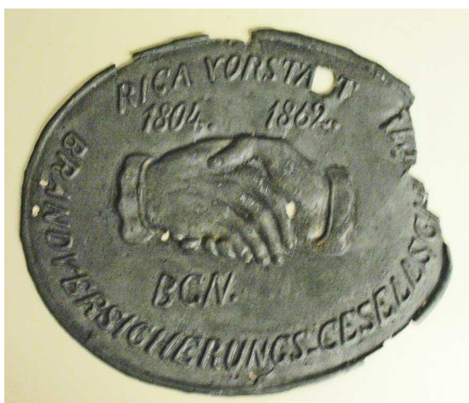
Rīgas Otrās savstarpējās ugunsapdrošināšanas biedrības īpašumu apdrošināšanas sienas plāksne. 1862.gads. LUM 3002

19.gs.20.-40.gados Rīgā darbību uzsāka vairākās privātas apdrošināšanas kompānijas, kas tika dibinātas kā peļņas kompānijas un līdz ar to radās