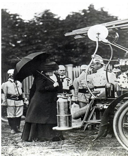
Krievijas ugunsdzēsēju biedrības patronese lielkņaze Marija Pavlovna ugunsdzēsēju VI kongresa laikā apmeklē ugunsdzēsības tehnikas izstādi. Rīga, 1910.gads