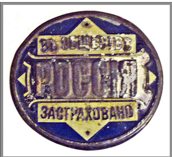
Ugunsapdrošināšanas biedrības Россия apdrošinātā īpašuma sienas plāksne. Krievija. 19./20.gs. LUM 1940

Apdrošināšanas biedrības bija ieinteresētas arvien vairāk paplašināt savu darbību, un pamatojoties uz rūpīgu ugunsgrēku analīzi, noteica atlaides apdrošināšanas maksājumiem, ja tika izstrādāti un ievēroti ugunsdrošības noteikumi. Atlaides tika noteiktas arī par celtnu ugunsdrošu konstrukciju un jumta pārsegumu ieviešanu, ugunsdzēsamo ierīču un stacionāro iekārtu uzstādīšanu. Šāda apdrošināšanas maksājumu atlaižu sistēma veicināja uguns drošu dzīvojamo namu celtniecību, ugunsdrošu šķēršļu joslu ierīkošanu, ugunsdrošu darbnīcu un rūpniecības uzņēmumu plānošanu un celtniecību. Pilsētas ugunsapdrošināšanas biedrības apmaksāja virkni pakalpojumu, piemēram, ja pilsētu iedzīvotāji piegādāja ūdeni ugunsgrēka vietā, uz ugunsgrēka dzēšanas vietu atnāca ar spaiņiem, keķšiem, lāpstām u.c. darba rīkiem. Apdrošināšanas biedrības atbalstīja arī brīvprātīgo ugunsdzēsēju kustību-subsidēja brīvprātīgo ugunsdzēsēju biedrības, brīvprātīgie dzēsēji saņēma naudas prēmijas, ja tie pirmie ieradās ugunsgrēka vietā, iedalīja naudu pilsētu pašpārvaldēm ugunsdzēsības inventāra un aprīkojuma iegādei, prēmēja labākos ugunsdzēsējus, deva būvmateriālus dzīvojamo namu un darbnīcu celtniecībai.