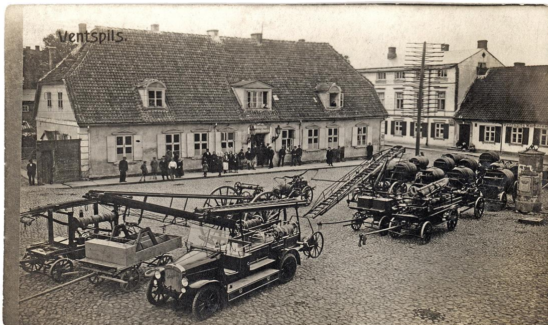
Ventspils Brīvprātīgo ugunsdzēsēju biedrības tehnikas parāde Rātslaukumā, 20.gs. 20.gadi LUM 1475

1936.gada augustā Nīcas un Bernātu ugunsdzēsēju komandām materiālu palīdzību ugunsdzēsēju rīku iegādei sniedz Nīcas savstarpējā ugunsapdrošināšanas biedrība.