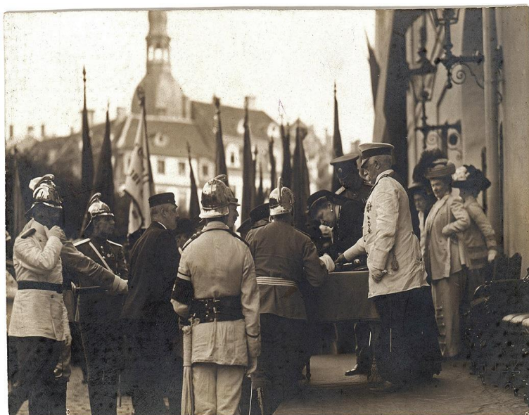
Krievijas ugunsdzēsēju biedrības patronese lielkņaze Marija Pavlovna ugunsdzēsēju VI kongresa laikā tiek ar Rīgas ugunsdzēsējiem. Rīgā, 1910.gadā.

veica ugunsdrošu celtniecības darbus, piešķīra līdzekļus ugunsnedrošo salmu jumtu nomaiņai ar labākās kvalitātes jumtu segumiem, atvēra cementa ražošanas darbnīcas, palīdzēja zemnieku biedrībām organizēt un vadīt ķieģeļu ražošanas darbnīcas, veicināja un kreditēja jaunu ugunsdrošu celtniecības materiālu ieviešanu, atvēra speciālas apmācību darbnīcas un laboratorijas, kā arī ugunsdrošu celtniecības materiālu noliktavas. Tā trijos gados 1905.g.-1908.g. šim nolūkam zemstes izlietoja 14 milj. rubļus. Taču Krievijas guberņās ugunsgrēku skaits arvien pieauga, un sasniedz milzīgus apmērus. Kā 1909.gadā raksta Krievijas Ķeizarkās ugunsdzēsēju biedrības žurnāls Požarnoje Delo ,: “Krievija izdegs 25-30 gados, un katru gadu dūmos un pelnos pārvēršas 400-500 miljoni tautas bagātības, negribas ticēt, bet skaitļi vislabāk parāda.”