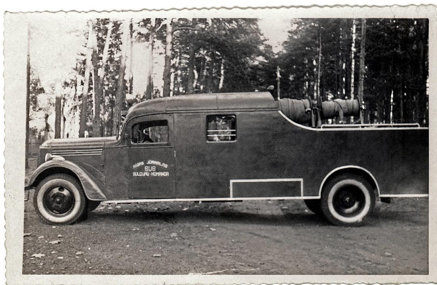
Bulduru Brīvprātīgo ugunsdzēsēju biedrības automobilis, 1932.gads LUM 4027

1932.gadā viena no vecākajām Rīgas Jūrmalas biedrībām- Bulduru Brīvprātīgo ugunsdzēsēju biedrība (dib.1869.g.) iegādājās motorsūkni, Rīgas Jūrmalas savstarpējā ugunsapdrošināšanas biedrība piešķīra 400 Ls. motorsūkņa iegādei.