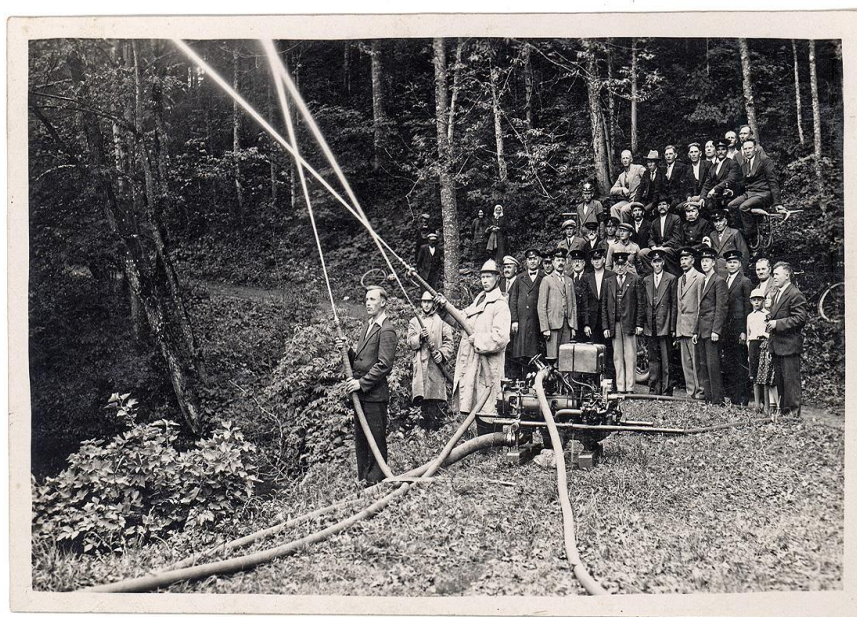
Jauna motorsūkņa pārbaude ugunsdzēsēju biedrībā 1936.gadā LUM 3975

1940.gada februārī Mārsnēnu lauksaimniecības biedrība iegādājas cementa jumtu dakstiņu izgatavošanas ierīci, kura maksā 4000-5000 Ls., vietējā ugunsapdrošināšanas biedrība ziedo 2, 500 Ls. ierīces iegādei. Novadā jūtams liels kokmateriālu trūkums, tādēļ jāmeklē citi materiāli būvniecības paplašināšanai un jāveicina jaunu ugunsdrošu jumta segumu izmantošana būvniecībā.